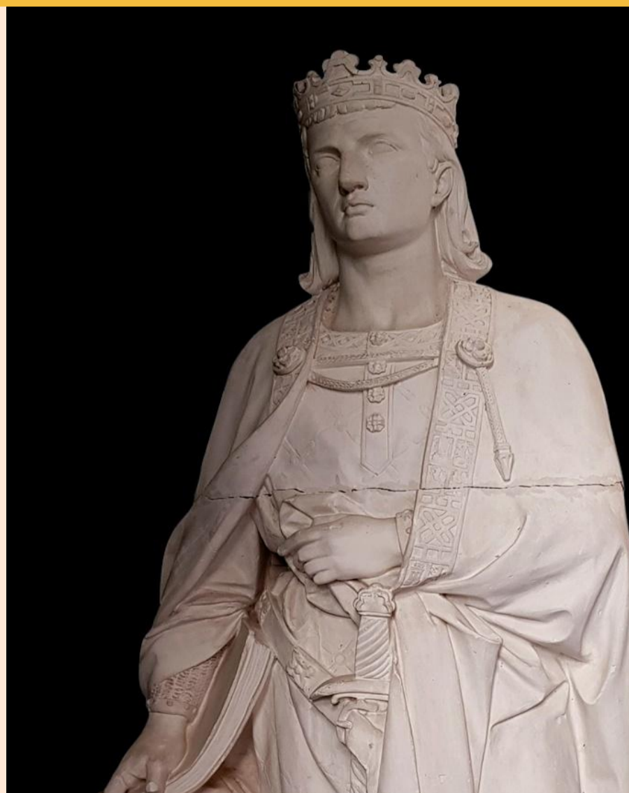
Boceto de escultura del rey Alfonso X el Sabio, realizado por el escultor Toledano Eugenio Duque y Duque.

Entrada libre y gratuita, hasta completar el aforo determinado por la normativa sanitaria vigente.