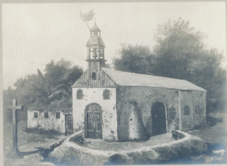
Iglesia de Baler (Filipinas) donde el destacamento sitiado estuvo defendiéndose desde el 30 de junio de 1898 al 2 de junio de 1899

Museo Histórico Militar Antonio Martín 1-3-1940