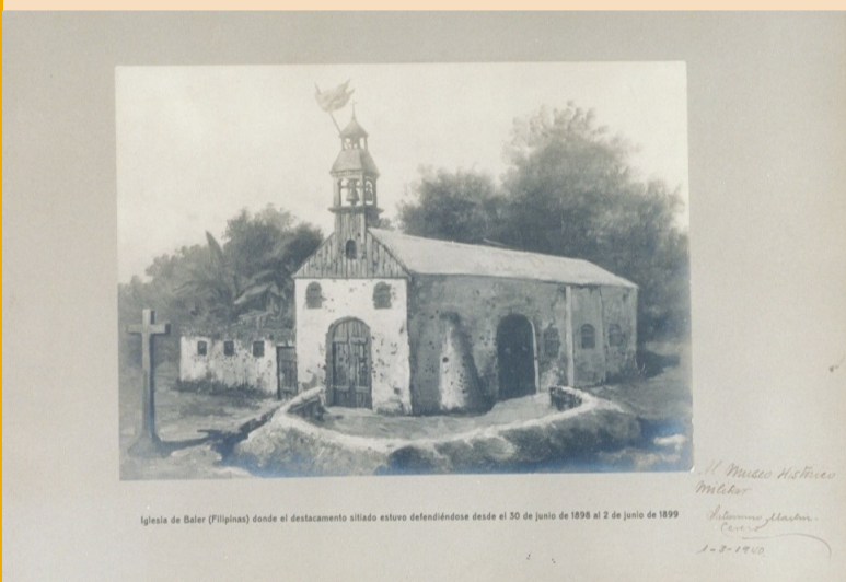
Iglesia de Baler (Filipinas) donde el destacamento alzado estuvo defendiéndose desde el 30 de junio de 1898 al 2 de junio de 1899

Iglesia de San Luis de Tolosa, pueblo de Baler, isla de Luzón, Filipinas: «Esos tagalos están siempre al acecho. Los víveres empiezan a escasear, el calor es insoportable y el maldito beriberi no nos da ni un respiro. ¿No querrán ustedes también convencerme de que nos han ganado la guerra? No traten de engañarme, no nos rendiremos. Resistiremos. Se lo aseguro».