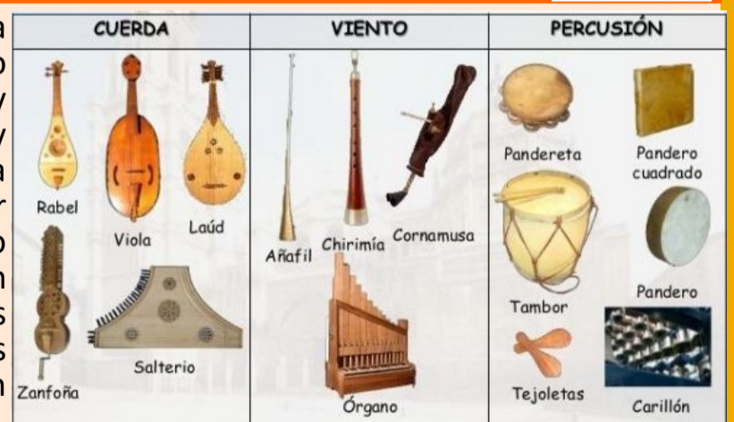
Instrumentos musicales de la Edad Media

Por la festividad de Santa Cecilia, patrona de los músicos y de la Música, os ofrecemos una actividad muy melódica: un concierto didáctico. Lo vamos ambientar en otras épocas, como la antigua y medieval. Pero nuestros músicos no sólo interpretarán piezas y melodías de esas épocas, sino que os invitarán a los participantes a conocer más sobre cómo era la composición antiguamente, a conocer más sobre el ritmo, la armonía o la melodía, mostrando por supuesto cómo funcionan diversos instrumentos de época. También explicaremos cómo se llevaba a cabo la construcción de esos instrumentos y aprenderemos sus secretos, experimentando con ellos si fuera necesario. ¿Os animáis a un domingo musical? Y si tocas un instrumento ¡tráelo y participa en nuestro concierto!