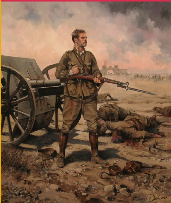
Capitán Arenas. Óleo de Augusto Ferrer Dalmau.

En el Auditorio del Museo del Ejército se proyectará el documental “ Capitán Arenas, un destino en Monte Arruit ”.