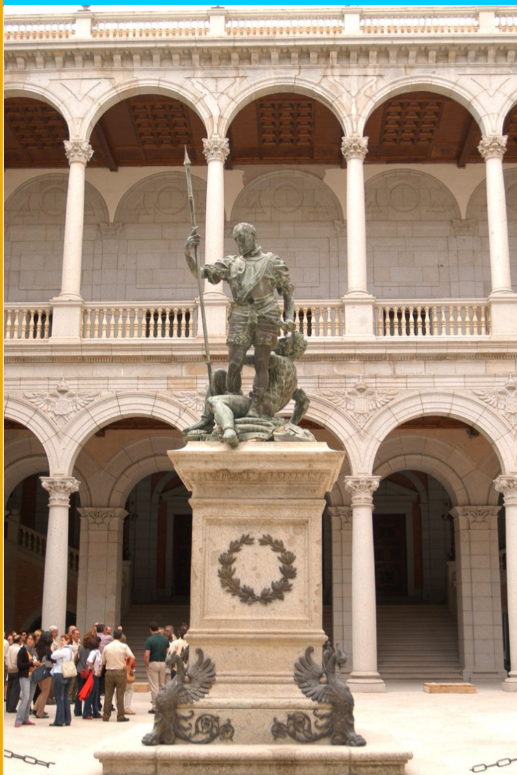
Estatua. Carlos V derrotando al furor del escultor milanés Leo Leoni -1549-

Muchas estatuas que conocemos por nuestras calles y plazas llevan muchos, pero que muchos años allí. Algunas incluso antes de que vuestros abuelos hubieran nacido. Todas ellas están muy, pero que muy quietas, desafiando al tiempo. Algunas observan todo lo que les rodea y saben mucho de nuestra historia. A otras en cambio no les gusta estar todo el día quietas y desearían salir corriendo para ver otros lugares del mundo. En la historia de hoy os contaremos lo que hizo una estatua, muy famosa de nuestro museo, para conocer mundo sin moverse de Toledo.